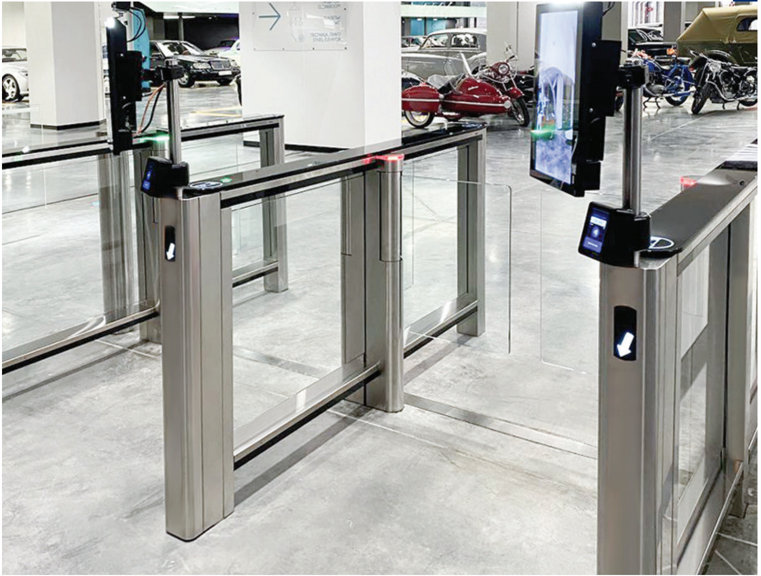
Скоростные проходы ST-11, фитнес-центр Ve you, Нидерланды