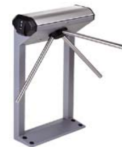
Электронная проходная PERCo-KT03/600-1