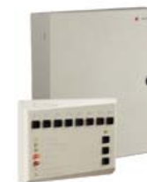
Прибор приемно-контрольный охранно-пожарный PERCo-PU01

Выбор исполнительного устройства производится в разделах "Электронная проходная", "Замки", "Турникеты-триподы", "Роторные турникеты" и "Калитки" настоящего прайс-листа. Выбор карт доступа и брелоков формата EMM – в разделе "Считыватели и карты доступа".