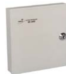
Контроллер турникета PERCo-SC-610T/L