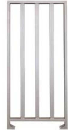
Секция полноростового ограждения серии PERCo-MB-15