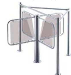
Турникет PERCo-RTD-03S с формирователем PERCo-RB-03S