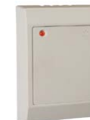
Контроллер управления доступом PERCo-SC-800