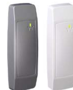
Считыватели PERCo-RP-15.2 PERCo-RP-15.1MW PERCo-RP-14.1MW