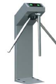
Турникет-трипод с планками Антипаника PERCo-TTR-04.1G

1. Под заказ возможна окраска турникетов в другие цвета по каталогу RAL. Срок изготовления и стоимость оговариваются дополнительно.