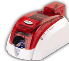
Принтер Evolis Pebble4 USB