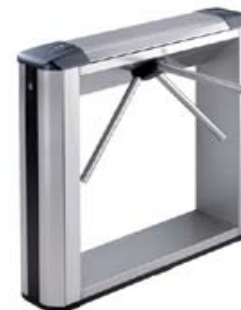
Электронная проходная PERCo-KTC01 со встроенным картоприемником