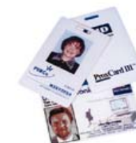
EM-Marin proximity cards