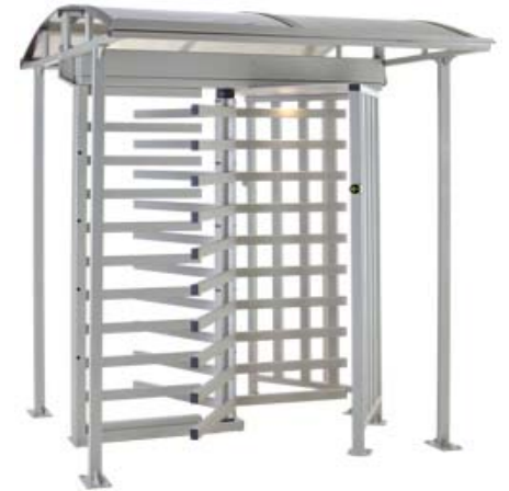
Полноростовый роторный турникет PERCo-RTD-15R с крышей PERCo-RTC-15R