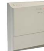
Контроллер замка PERCo-CL02