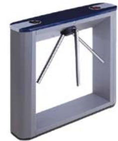
Тумбовый турникет-трипод с планками Антипаника PERCo-TTD-03.1G