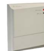
Контроллер замка PERCo-CL02