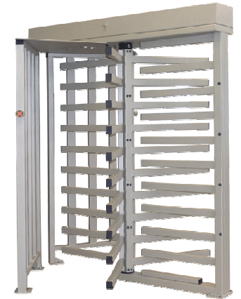
Полноростовый роторный турникет PERCo-RTD-15R