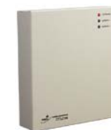
Контроллер замка/турникета PERCo-CT/L04