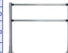
Стационарная секция ограждения серии PERCo-BH01 с прямыми патрубками