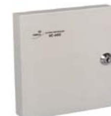
Контроллер замка PERCo-CL-12200E