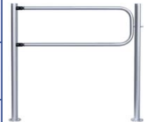
Поворотная секция ограждения серии PERCo-BH01 с шарнирами