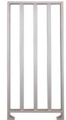
Секция полноростового ограждения серии PERCo-MB-15