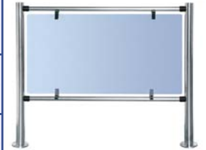
Стационарная секция ограждения серии PERCo-BH01 с прямыми патрубками и заполнением