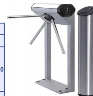
Электронная проходная PERCo-KT04, включающая картоприемник PERCo-IC02, в комплекте со стандартными планками

Электронная проходная PERCo-KT04 является комплектом, предназначенным для организации контроля за проходом сотрудников и посетителей, сбора разовых пропусков, кадрового учета, учета рабочего времени