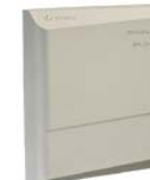
Контроллер замка PERCo-CL02