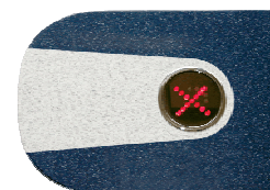
Крышка турникета с индикатором PERCo-C-03G blue