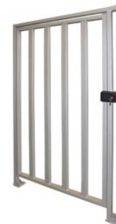
Полноростовая калитка PERCo-WHD-15R