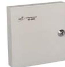
Контроллер турникета PERCo-SC-610T/L