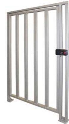
Полноростовая калитка PERCo-WHD-15R