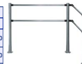
Стационарная секция ограждения серии PERCo-BH01 с прямыми и поворотными патрубками