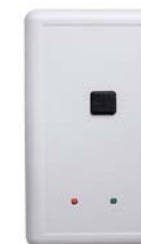
Контроллер конфигурации PERCo-SC-810