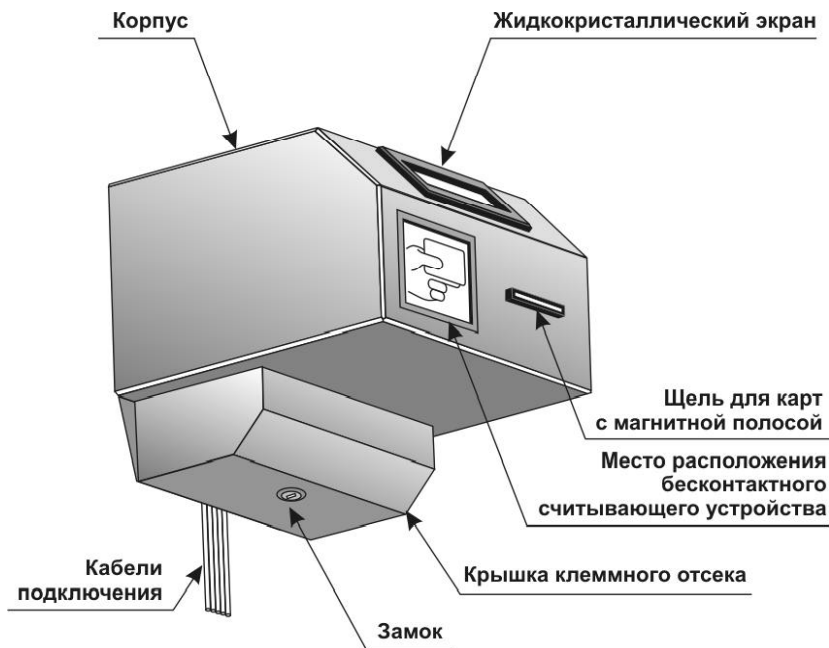
Рис. 1. Контроллер управления доступом. Внешний вид.

ром магнитных карт ТТРМ2 текущее техническое обслуживание производится в соответствии с документом "ТТРМ2. Билетный принтер/кодер. Руководство по техническому обслуживанию". В случае комплектования контроллера считывателем магнитных карт типа JST-6230 текущее техническое обслуживание заключается в очистке магнитной головки считывателя по методике, изложенной в подразделе 2.2.