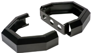
Комплект сегментов торцевых