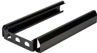
Комплект сегментов основных