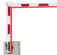
Стрела шлагбаума с шарниром для сгибания PERCo-GBF1