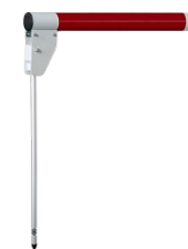
Стойка опорная подвесная на стрелу шлагбаума PERCo-GBS2