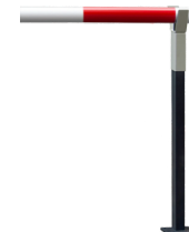
Стойка опорная с ловителем стрелы PERCo-GBS1